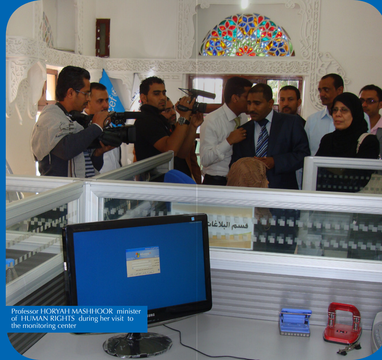
Professor HORYAH MASHHOOR minister of HUMAN RIGHTS during her visit to the monitoring center

In mid-2011, the legal advocacy section was developed to an independent unit with the aim of addressing increasing complains Seyaj received on a daily base.