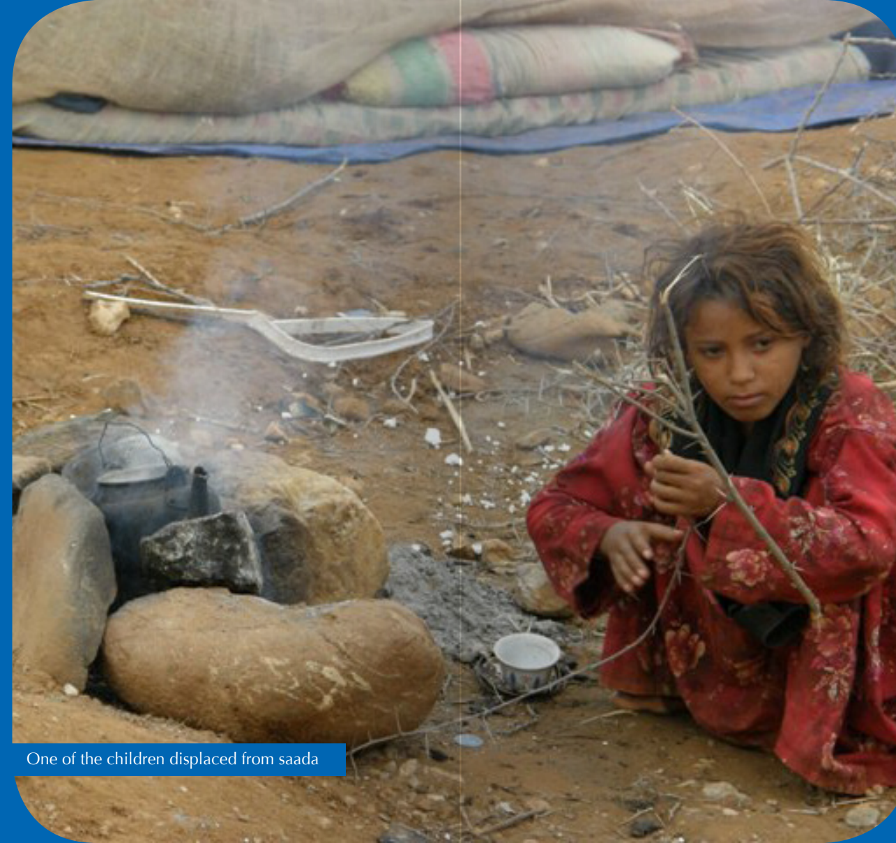
One of the children displaced from saada