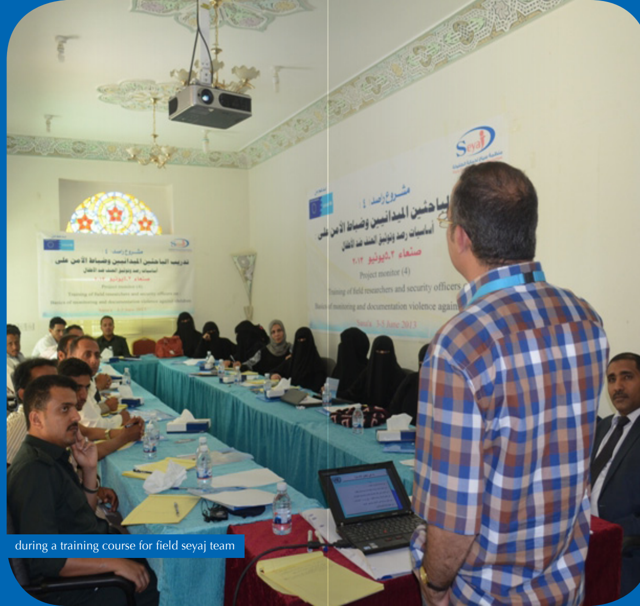
during a training course for field seyaj team

Most volunteers were trained during the past years.